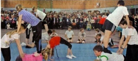
Mit musikalischen und sportlichen Vorführungen gestalteten Humboldt-Schüler aller Klassen das Programm zur Wiedereröffnung der Sporthalle.

Korbach. „Wir gestalten unsere Schule“. Unter dem Motto stand die Projektwoche an der Humboldt-Schule, die gestern mit der Präsentation der Ergebnisse zu Ende ging. Eltern, Lehrer und Elternhilfe konnten in vielen Räumen der einstigen Grundschule mit Förderstufe im Landrats auf Fortschritte mitgehen. Nicht ganz so abenteuerlich wie vor mehr als 200 Jahren die Gelehrer Alexander und Wilhelm von Humboldt. Mit den Naturgebern der Schule hatte sich eine Gruppe interessiert befasst, anhand einer Zeitfabel und einer Werkkarte wurden die Stationen im Leben der Forscher dargestellt. Ersteindrucke gab es in der Projektgruppe „Aestium ist in“. Vor allem der Bericht ei-